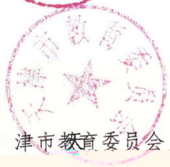
天津市教育委员会