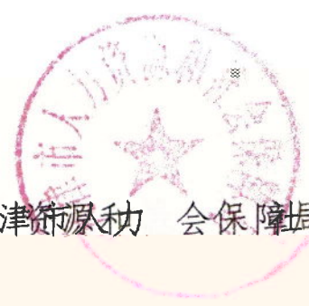
天津市人力资源和社会保障局