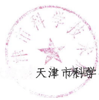
天津市科学技术局